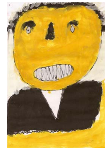
Senegalilainen näkemys Väinämöisestä.

Yhteistyössä Turun ammattikorkeakoulun kirjasto- ja tietopalvelun koulutusohjelman kanssa perustettu kirjasto oli aktiivisessa käytössä. Lukutaito-opetusta järjestettiin kolmesti viikossa ja siihen osallistui viikoittain n. 40 aikuisopiskelijaa, joista suurin osa oli nuoria naisia, joiden koulunkäynti oli jäänyt syystä tai toisesta kesken. Kirjaston yhteydessä järjestettiin kaksi kertaa viikossa lasten satutunteja ja luovaa toimintaa, joiden ohjaajina toimivat paikallisten asukkaiden lisäksi suomalaiset residenssitaiteilijat.